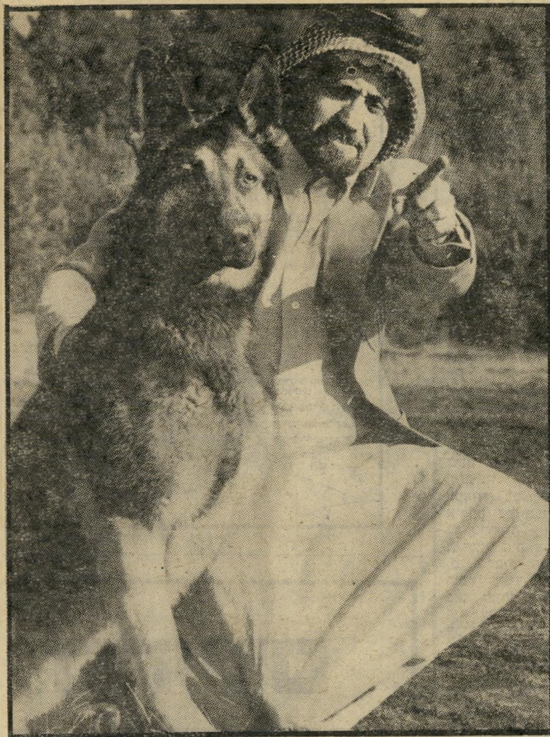
רועה גרמני עם בעליו החדשים: שיחה נפנט מקאטאר הכלב — סמל למעמד

לכל כלב מיוחס שכוח ישנו מאמן פרטי שאיננו ואינך אותו, ואם בעל-הבית מביא לילדו אומנת צרפתייה, רק טבעי בעיניו לקנות את הכלב יחד עם המאמן, ומוטב