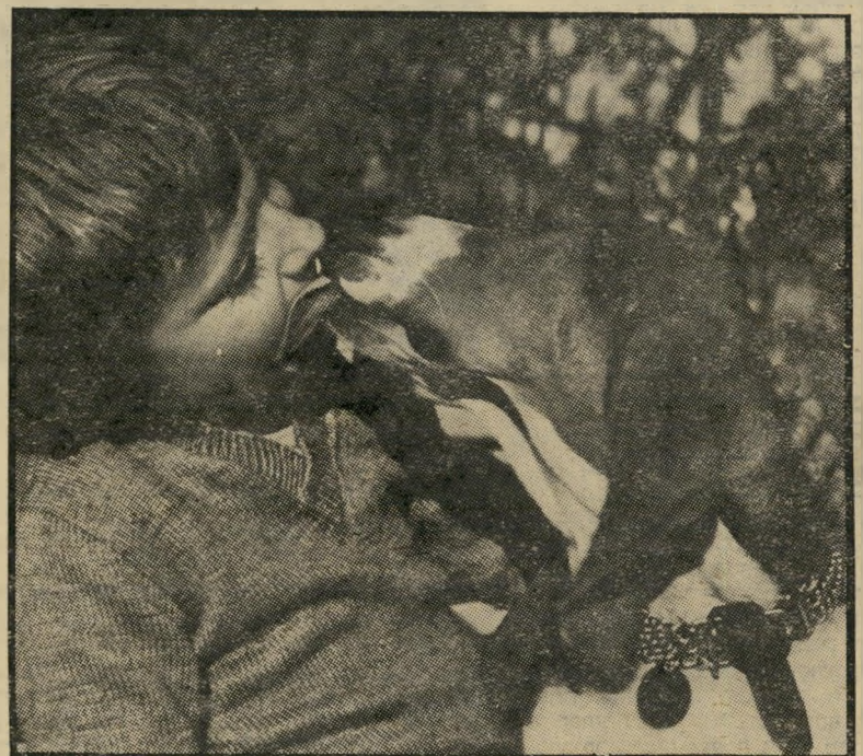
האקי מדקק חבר לא מפה 97

שוחה, הגש לו מים בכמויות קטנות, ישר לתוך פיו. (4) תן לו אוכל קל, בכמויות קטנות. חשוב עליך כשאתה עצמך משופע. וטיפ קטן לאמהות מודאגות ממישנתו של הד"ר לואיס ל. ויין: הכלב מאמץ לו את כל התופעות המוררות של בני הבית. הם חולים — הוא יתחלה כמותם. אבל האמת הרפואית מגלה, כי הכלב מסוגל לקבל יותר מחלות מן האדם. מאשר האדם מן הכלב. כדאי לזכור זאת כשמשחקים במי-נדבקים.