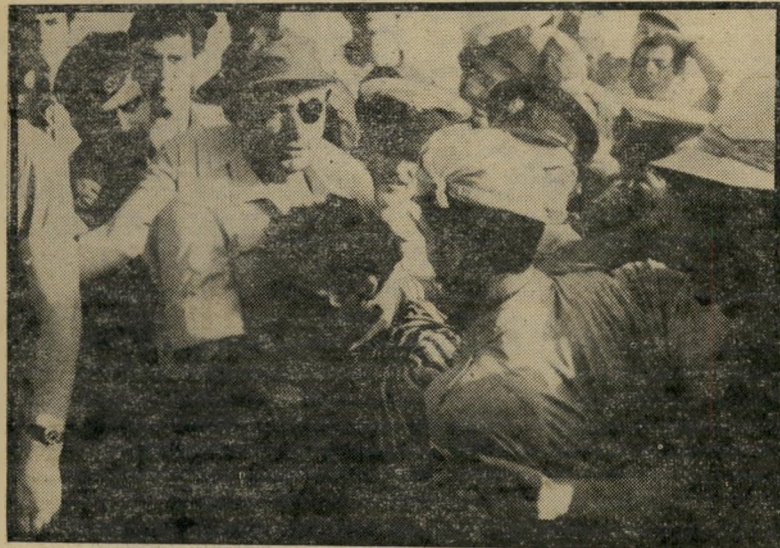
דיין אחרי יום הכיפורים „אז מה יש לדבר“

תוך העלאת מחירי הנפט. יש בינינו אף כאלה הסבורים כי הדיפלומטיה האמריקאית, מטעמים מדיניים שחלקם נעלמים מאתנו, תומכת בכל הזדמנות באלה ה"תובעים להחיש את קצב העלאות המחיר". שרייבר מאשים את קיסנינג'ר בנפילת השאה של איראן, שהקדיש את כל משאבי ההון שלו להקמת הצבא שלבסוף היפנה לו עורף. מדיניותו זו, טוען שרייבר, הביאה לתהוירובוהו פוליטי, תהוירובוהו כספי, תהוירובוהו חברתי — ארצות-הברית והעולם כולו עדיין משלמים את המחיר.