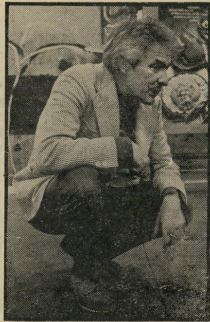
במאי ג'ון קאסאבטס בתנאי שהוא יביים

כל זה נשמע מוזר מאוד לסרט של ג'ון קאסאבטס, אך לא זו בלבד: יש בו נימה מבודחת העוברת כחוש השני לכל אורכו. יש גם קצב מזוהר, שבו מתנהלת המילחמה הפרטית של הכוכבת בסינדיקט הפשע. יש בו קרבות אקדחים, מירדפי מכוניות ודיאלוגים הנשמעים כיריות של צלפים. ברור לכל מי שצופה בכל ההתרחסות, שכל הנוגעים בדבר הוציאו עצמם לחיפשה מרצון והחליטו לבלות כטוב ליבם עליהם כשהמצלמות מופעלות בעקבותיהם. הבמאי נהנה לביים פעם אחת בכלי התחייבויות וכוונות עמוקות. השחקנית נהנתה לשחק תפקיד שבו היא יכולה לעשות את הכל מבלי שמשוהו יראה מוגזם. ואם מישוהו תוהה על הקצב המשוגע, ההסבר