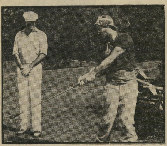
ביל מארי וצ'יבי צ'ייס: כישלון

נוך את היאכטה החדשה שלו, ומתעשר חדש בא עם יאכטה כפולה בגודלה כדי להטביל בדרכו את הספן החדש. או דוגמה נוספת להמצאות: תחרות הגולף המסיימת נוטל חלק גם הייל משוחרר, מופרע למדי, שנלחם בחול-דוה כמו שנלחמים בוויאט-קונג, בעזרת חומר-נפץ. אם זה נשמע מצחיק, ראו הוזהרתם: על המסך זה נמשך הרבה יותר מן הזמן הדרוש כדי לקרוא שורות אלה.