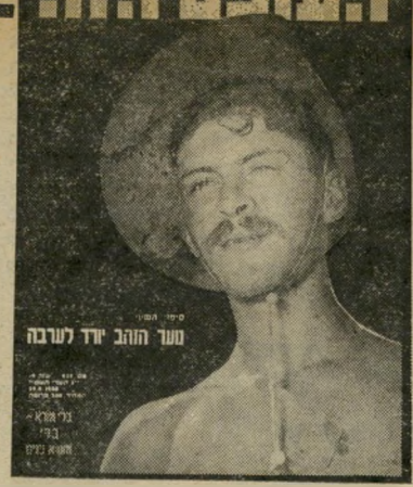
"העולם הזה" 937 תאריך: 29.9.1955

אולם מולה של הפועל כפריסבא בגד בשבת האחרונה והיא נוצחה 4:3. אותה שבת האירה פנים רק לאחת משתי קבוצות הכדורגל באסי-המושבות. היתה זו קבוצת הפועל פתח-תיקוה. שהחזירה 13 שערים לעומת שניים של הפועל בלפוריה. על מיגרש מכבי הסמוך נוצחה קבוצת מכבי פתח-תיקוה עליידי מכבי נתניה 1:0. נותרו עוד שלושה שבועות לסיום הליגה. מכבי תל-אביב והפועל פתח-תיקוה צועדות בראש במספר נקודות שווה (34). סימן השאלה הגדול סביב תעלומת הליגה עומד להיפתר בעתיד הקרוב ביותר.