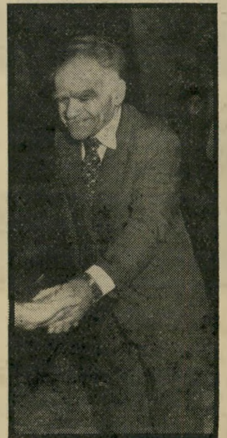
יצחק שמיר חידו משופע הבטחות

מזל מאזנים - מזל אינטלק-טואלי כיתור מזלות האוויר, ו-