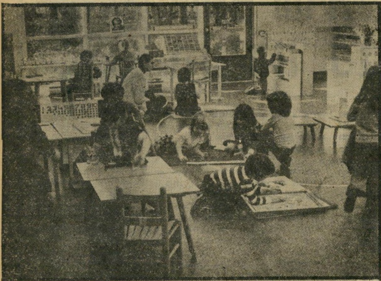
חכמים בפעולה בזמן התהוותם

האבירים כוללים תרגילים בחיי יומיום, שנועדו לסייע לילד להיות עצמאי בסביבתו, ולעודד את ביטחונו העצמי, ואברי זרים לעידון החושים, המיועדים לפיתוח האינטליגנציה של הילד, המבוססת על אירגון ומיון.