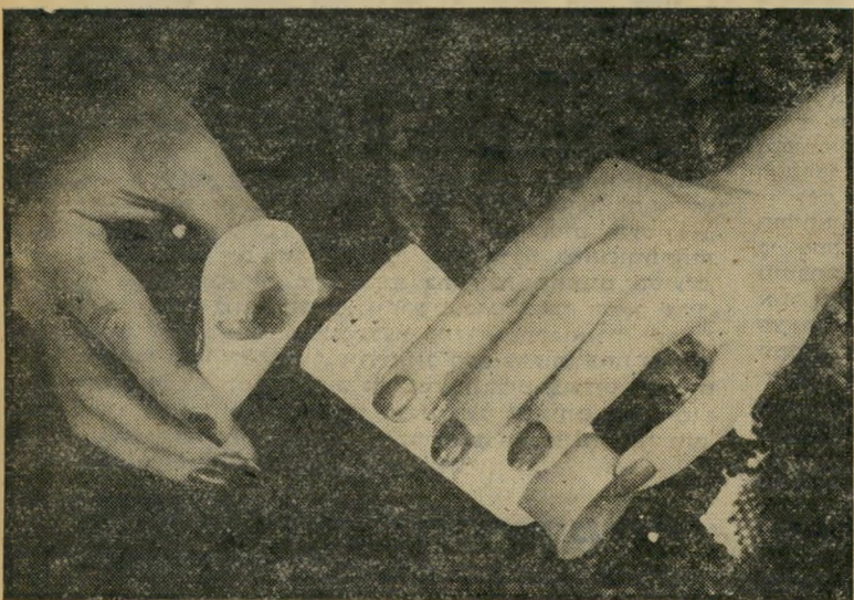
ניצודת מזאה של קרם ואיך

דודתי המשוגעת כבר שנים עושה את זה. כשהקדם נגמר לה, היא תוססת מיסריים, ובשניט אמיץ אחד, היא גוזרת את הטובה שלוש. פתאום נפתח קרביים, ואפשר להצ'ץ. בירכתה, ליד הפקק, בכל מתרח בניחותה טונה קרם. את החלק האמצעי היא מנקה מיד, וי