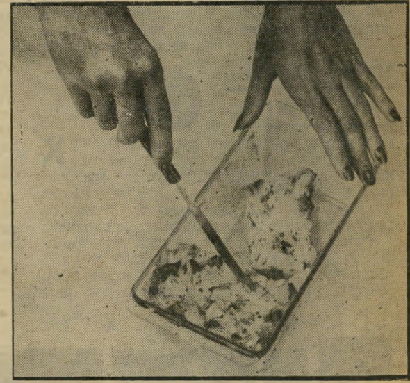
פשטירת-כבד איך עושים ואיך אוכלים ואיך מתים מזה

ולעבודה: מבשלים בסיר גדול עם מים בלבד! בלי מלח! שתי חביליות איטריות מאורכות הכי פשוטות וזולות, כל חבילה זה 250 גרם, כך שיוצא לבשל 500 גרם איטריות, כאשר זה רך, מטגנים את המים, ושופטים.