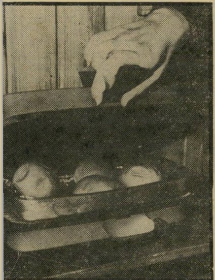
טוסטר עם מגשית רשימת רעיונות

צדק לטגן עוד פעם, ומאידך, גם לא ל- טגף מכסה ומחבת, ציפסים קפואים, ש ניצלים קפואים, וכל מיני קפואים מוכנים, מתחממים יופי יופי בעסק הזה, ונא לא להחסם פסיכולוגית בגלל גובה המגשית, המזון יכול בהחלט להיות גבוה יותר מה- דפנות, ולא "סגור הרמטי", מכסימום הוא מקבל פסי שיוף של טוסטר, אפשר לקנות שתי מגשיות, ולסדרן כך שאחת תהיה ה"סיר", והשנייה שתשען על שוליה עם הפתח לפני שיוף בתור "מיכסה", אבל לא ניראית לי כל הטרחה.