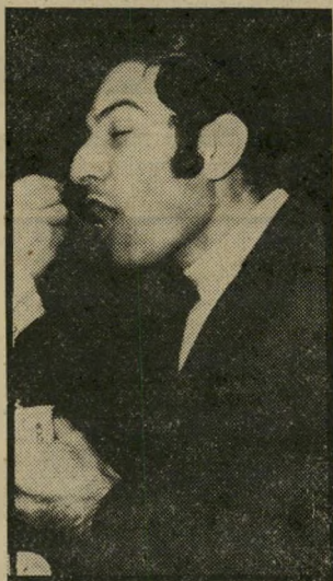
מנהל טוויג משרד ומכונית צמודה

אם לא יקום גורם שיאחד את כל הגורמים המעורבים בפיתוח תיירות ים-המלח, תפסיד ישראל מילי-יוני תיירים שרוצים לבוא למקום כדי להירפא. אך נרחעים מהתנגדים הנחשבים לתנאי ימיה-הביניים בעולם התיירות.