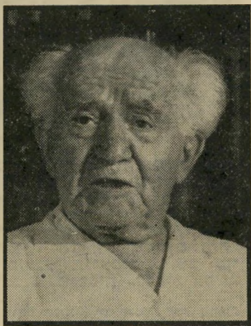
בן-גוריון אינו אוהב פקודות

דברים אלה מוציאים אותם מהאזינון לו הם זקוקים, ואף גורמים להם לדיכאונות ורפיון ידים, או חוסר יכולת לתפקד. מאזניים — המזל השולט על ההרמוני-