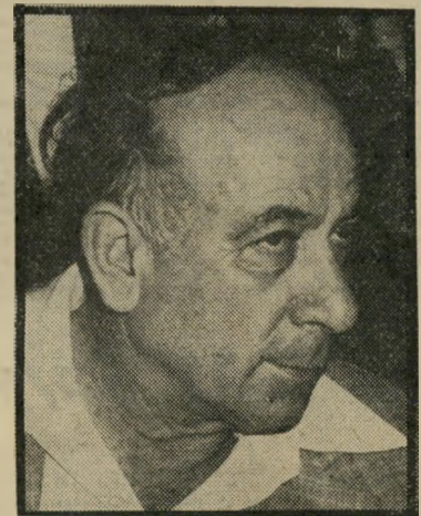
יגאל הורביץ מסוגל להתווכח על כל דבר

שני הצדדים היא בעוכריהם, בגלל תכונה זו אינם מסוגלים להחליט, הם פוסחים על שתי הסעיפים, ומתענים עד שמגיעים להחלטה כלשהי. גם לאחר ההחלטה אינם בטוחים שאכן זו ההחלטה הנכונה. על-פירוב הם מנסים להתייעץ עם כל אחד, אנשים בעלי אישיות חזקה מסוגלים להשמיע עליהם לנהוג בצורה זו או אחרת, אם יתנו להם את ההרגשה שבכל זאת הם (המאזניים) הקובעים. הם אינם אוהבים פקודות, כפייה או