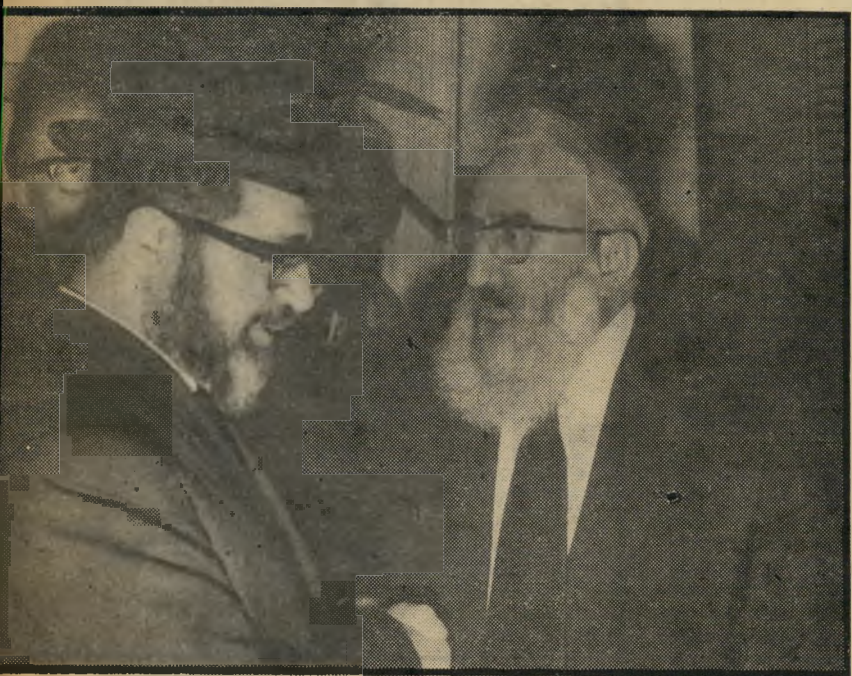
נס בירושלים: שלמה גורן ועובדיה יוסף אינם מסכימים על שום דבר — חוץ מאשר על חוות-הדעת שבאה לסכל חקירת שחיתות

אם התקבל חוות-הדעת של הרבנים רבנים, כי עדותם של עדי-מדינה פסולה מעיקרה, ואסור לקבלה — יש לשחרר מיד את מרבית ה