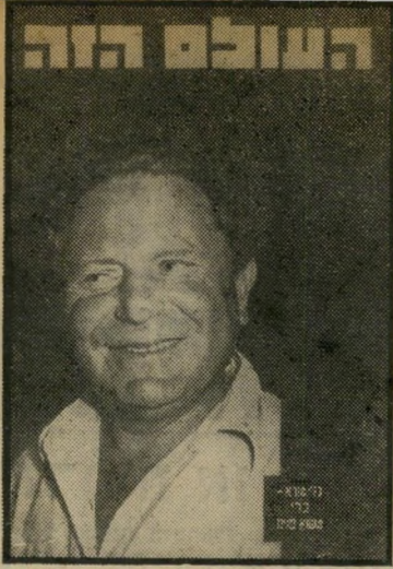
"העולם הזה" 880 תאריך: 2.9.54

גיליון "העולם הזה", שראה אור השבוע לפני 25 שנה בירושלם, הקדיש כתבת-רקע מרכזית למוניטין דור הפלמ"ח, תחת הכותרת "כמו יצחק שדה ועד ישראל גלילי". פרשן השבועון לענייני ביטחון פירסם כתבה נרחבת, תחת הכותרת "האיש בנימין הלבוני", שבחנה בהרחבה את כתיבת בוח משקפי האוי"ם, תפקידו ואורח החיים של אנשיו. אחד מכתבי השבועון סיקר את עניינה של "א/ק תל-אביב", בנמל איסאקה, ופאן. במדור "במדינה" סוקר ביקורו הראשון של נשיא המדינה,