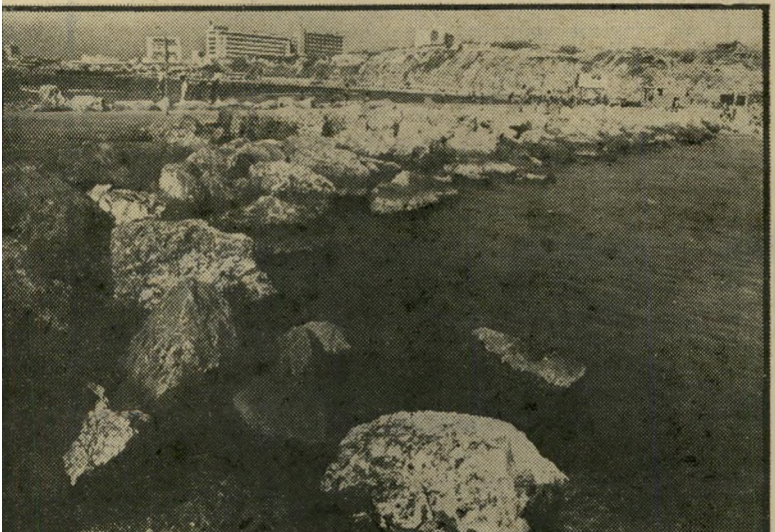
חוף „שרתון“ בתל-אביב כמו שלולית עומדת