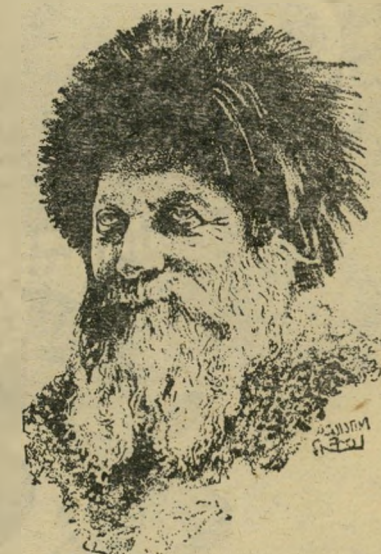
הרב קוק 1.9.1935

4.9 — יונת-דואר של ניל"י נתפסה בקיסריה והדבר הביא לגילוי המחתרת עלי-ידי התורכים.