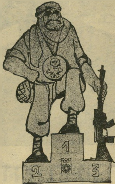
טבח מינכן 4.9.1972

4.9 — טבח 11 הספורטאים באולימפיאדת מינכן.