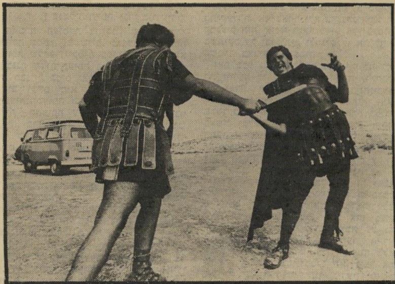
מוות בבית-נבאללה שני ניצבים ישראליים מתרגלים את כובד התלבושת הרומית שלהם ומנסים לאמוד את מידת הגמישות האפשרית בדוקר בדמוני. "פעם מילחמה היתה עבודת פרך", אמרו.

שני הגיבורים עונים לשאלות העיתונאים בקמצנות מחייכת. ארטול, המתואר בצדק באחת מן האנציקלופדיות הקולנועיות, "כשחקן כחוש המצליח להיראות על הבד גדול מן החיים" מקבל בסלחנות את העיתונאים, מה עוד שמאז ומעולם נטו לו חסד, ולא בחינם. להטוטי-אלגנטי זה פילס לו דרך בין הנרי השני בבקט, ללורנס איש ערב, מלורד ג'ים ועד אריה בחורף. גם אם התאמץ, לא הצליח ללכת לאיבוד על הבד כל אימת שהופיע עליו, אפילו אם לא בתפקיד ראשי. אשר לשטראוס, לפני ש"היה אליל המסך הקטן עשה סרט שהעיד על כישרון אמיתי, חייל בכחול עם קנדיס ברגן, ואם לשפוט לפי יחסו לתפקידים בעת האחרונה, נדמה כי הבחור היפה ניתן גם בשכל, הוא לא בולע כל פתיון המוצע לו. הוא סירב בעדינות לעצב את דמותו של בנין במרד, אך לא סירב לחזור ליש"ר ראל כמנהיג נצורי מצדה. "איני יכול שלא להרבות בשבחי ג'ון אוליאנסקי ש"כתב את התסריט ושבעיקר עומק נוסף לדמותו של בן-יאיר, שסבלה מרדידות במקור הספרותי. אלעזר של אוליאנסקי הוא מנהיג דגול, שאינו משחק את המנ"ח הגדול ובכל זאת ניתן בסגולות של הנהגה ובכוח של מנהיג אמיתי. שאבתי מן התסריט חומר רב למחשבה. אבל אם יורשה לי להביע את מחשבותי, הרי לדעתי אין זה מתפקידו של השחקן לתאר את תפקידו. הוא צריך לבצע אותו ולא להסביר אותו. כמו שפסל צריך להציג את פסלו והצייר לבטא את עצמו במכחול. אמנות אינה דיבורים."