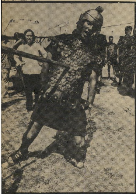
ז'ר "כך מת חייל רומי" מתלוצץ ניצב ישראלי, אחד המשתתפים ברט, רגע לפני תחילת העבודה.