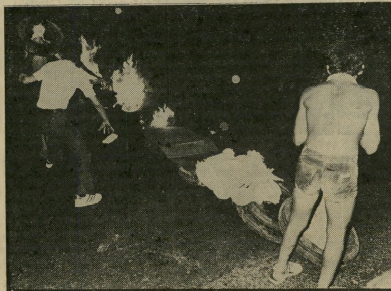
מפגינים שורפים צמיגים בדרך-קוד, גם אנחנו יודעים להרוס!

שולמית, בת 49, אם לחמישה ילדים, לא הצליחה, ככלתה הצעירה, לצאת מן המיבנה, כשזה החל קורס תחתיו. היא נלכדה בין הריסותיו. "שמעתי את השכנה שלי צועקת: יש אנשים בפנים, הרגתם את השכנה שלי!" סיפרה, "כלתי ניסתה לחלץ אותי מהריסות, אבל היא לא הצ"ליחה להזיז את האבנים."