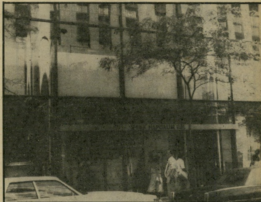
סניף "בנק הפועלים" בניו-יורק משהו באמצע

מדינה אחת, יצטרכו להודיע באיזו מדינה יפעלו, ורק בה יותר להם לפתוח סניפים נוספים. יתר הסניפים שהקימו יישארו ללא שינוי.