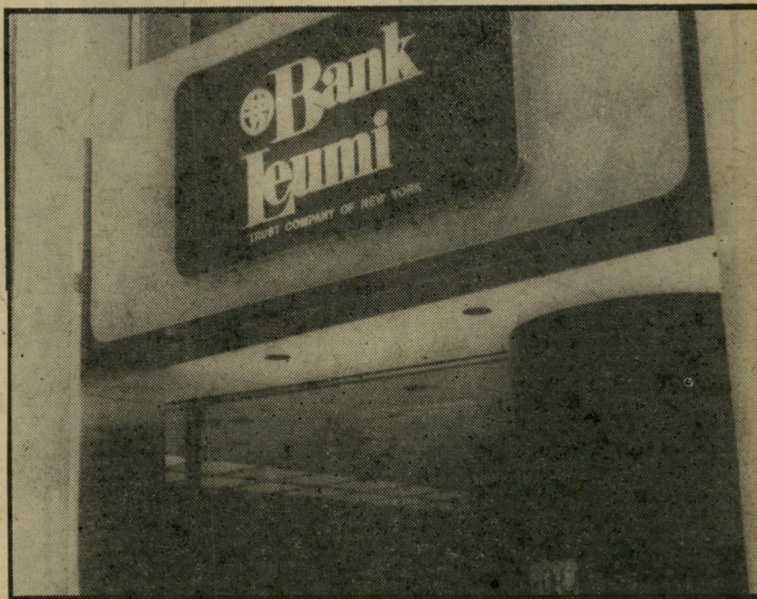
סניף "בנק לאומי" בניו-יורק סניפים בכל מקום