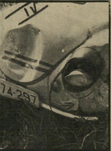
הפגיעה בחזית ה"פובארן" הגלגל נכנס לבור

א נותר לבית-הדין שפס אלא להחריט ליט אם בנהיגתו זו ידע לביא שהוא מסכן במודע חיים של אנשים, ואם נטל על עצמו סיכון זה. בכך נחלקו דיעותיהם של השופטים. השופט בר טען כי אילו שוכנע שהנא-