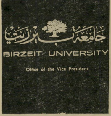
אוניברסיטת בירזית תודה

בהערכה רבה אנחנו רוצים לדווח לכם כי המאמצים שעשיתם למען אוניברסיטת בירזית עלו יפה. אנו משוכנעים כי ללא