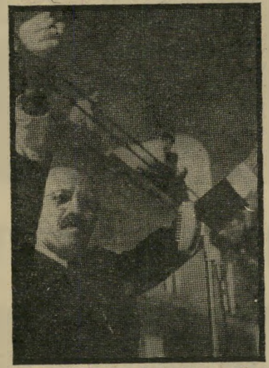
מפגין בנין 19.8.1965

16.8 — מטוס נוסעים לבנוני נחטף עלידי צעיר לובי ואולץ לנחות בנמל התעופה בן-גוריון. אחרי שהייה קצרה שוחררו הנוסעים ואנשי הצוות. המטוס הורשה להמריא והחוטף נעצר לחקירה.