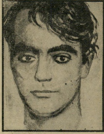
משורר לורקה 19.8.1936

15.8 — תעלת פנמה נחנכה במעבר הספינה אנגון מהאוקיינוס האטלנטי לאוקיינוס השקט.