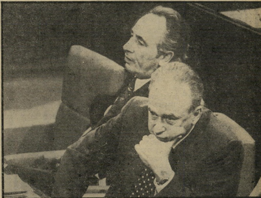
רבין ופרס ליד שולחן-הממשלה בכנסת דקירה אחרי שריטה אחרי מכה