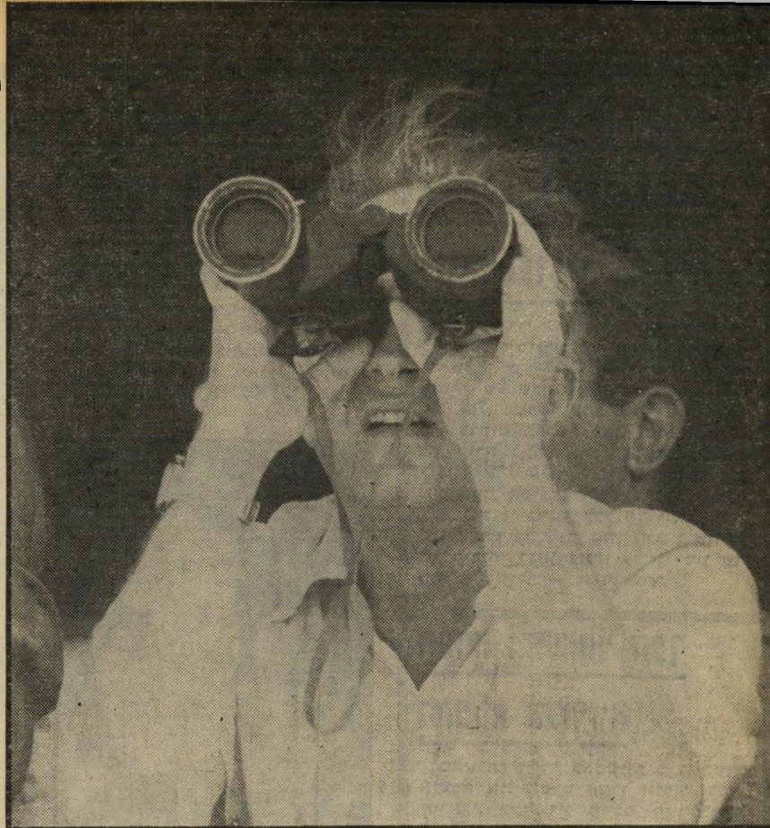
רבין בימי זוהרו: משקיף בתרגיל צבאי

לביא מנגן על כלי-התיקורת כמו על פסנתר. הוא הפך את נשקיה-הדלפה לאמנות וירטואונית. כשרצה להחדיר משהו לעיתוני ישראל, הדליף זאת בסוד לעיתון אמריקאי. כשרצה לתקוף את הממשלה, שם את הדברים בפי עיתונאי אופוזיציוני. כל כלי-התיקורת ניוונו מידיו, כי הוא חילק פרסים ומתנות בצורת סקופים יקר-ערך.