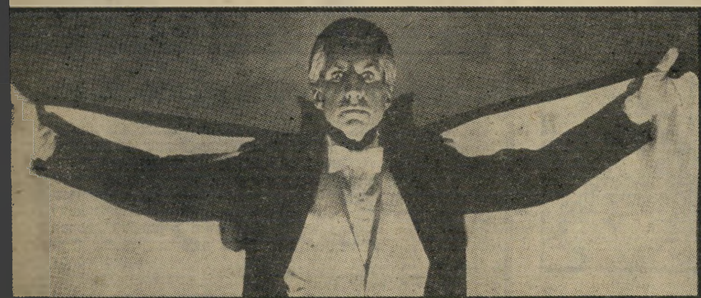
ג'ורג' האמילטון ב, "אהבה מנשיכה ראשונה" — 1979, הכובש בגלימה