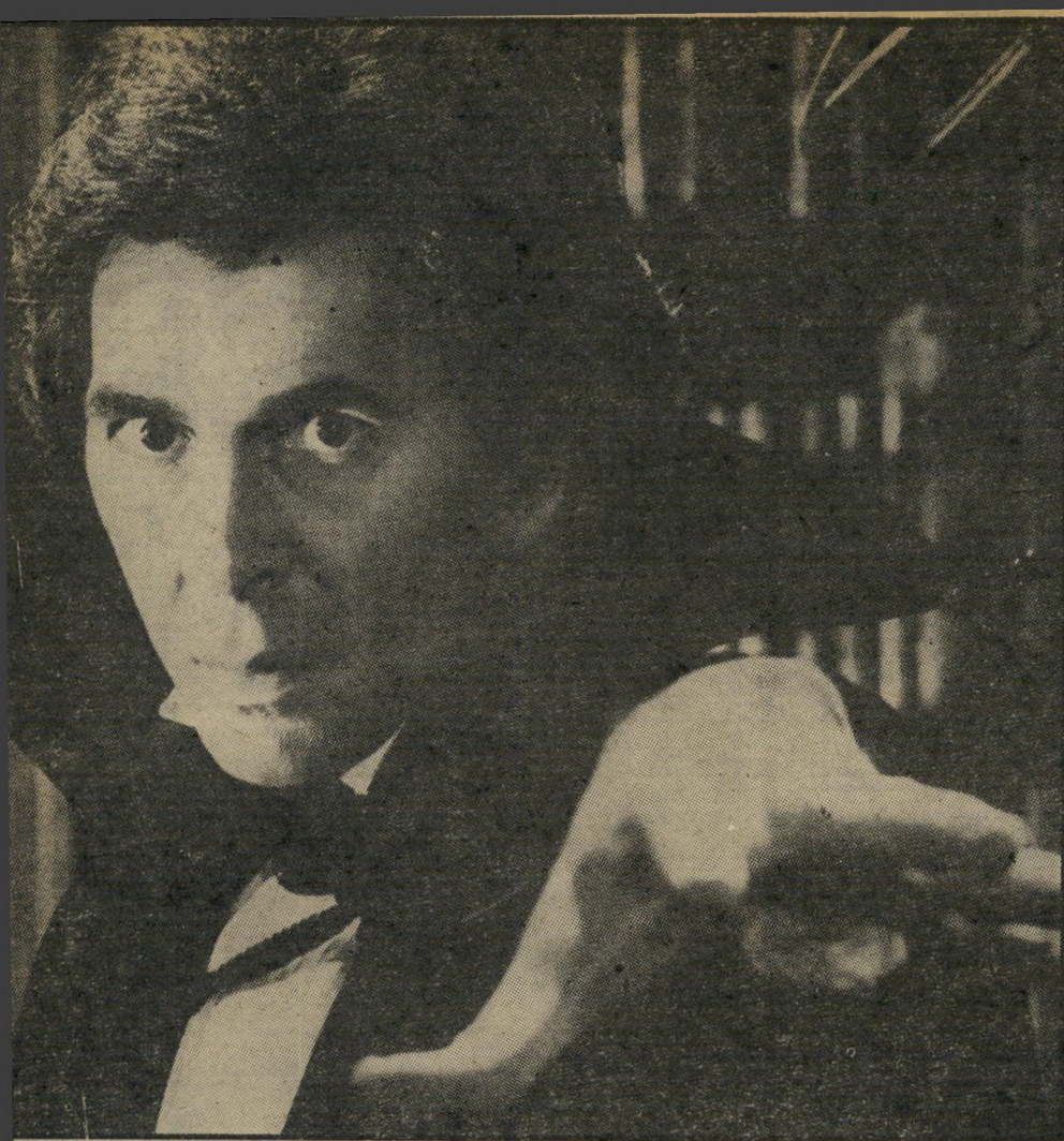
פרנק לאנג'לה ב, "דרקולה" — 1979 מהפנט קרבנות במבטו