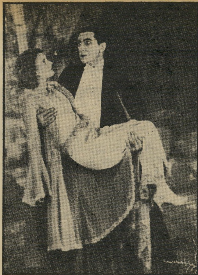
בלה לוגוזי ב, "דרקולה" — 1931: לגורל מר ממות