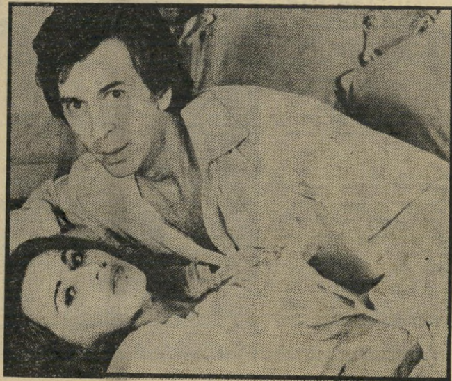
פרנק לאנג'לה: דרקולה הסקסי והקרוב המוכן לנשוך