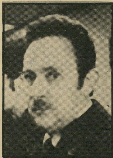
מנהל אבניאון לא מעורב

הסנה, לבקשת בעלי המניות של ישראל והמפקח על הביטוח, קיבלה על עצמה, ביום 17.6.1979 את ניהול ישראל. בעיקבות בדיקה שנערכה בחברת ישראל, הוגש, אר-