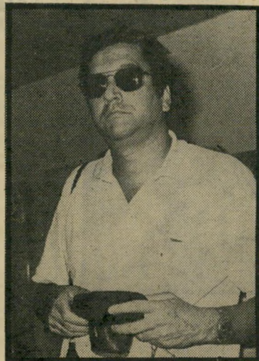
עוזר אחימאיר ללא קביעות