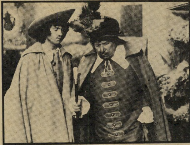
מוזייר: סינגר ומירמונט יום ראשון, שעה 10.00

● פליפר מאוהב (6.32). הפרק השני בסידרה הרוי-מנטית על פליפר. בשבוע שעבר נפגעה חברתו הדולפינית של פליפר ולא היה ידוע עליידי מי, מלבד לפליפר עצמו כמובן. בשידור של היום נפתרת התעלומה. הנער שפגע באהובתו של פליפר משתתף בתחרות סקי מים. פליפר נוקם בו ומכשיל אותו ואו נאלץ הנער להודות כי הוא הפוגע בפליפרית. ● סטארסקי והאקי