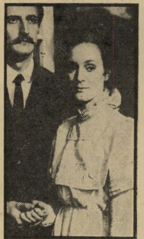
ליידי: אימארי יום שישי, שעה 9.20

● ריקוד החמישים סנט (9.20). הפרק האחרון של ליידי משודר במיקרה ביום מתאים: יום ששי ה-13 בהור דש, שהוא יום המקובל על המאמינים באמונות טפלות כיום נורא. אדוארד נפטר,