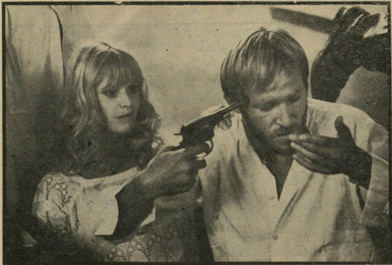
רוזטה רוסית של החברה הגבוהה תולדות הונגריה מתחילת המאה עד היום

אין זה הדימיון היחיד בין יוומה זו, 1900 ל ברטולוצ'י, המנסה להתמודד עם אותו הנושא באיטליה. אצל שניהם מדובר בשתי מישפות, אחת של אדונים, השנייה של משרתים, שתיהן ממוקמות בכפר, וי-