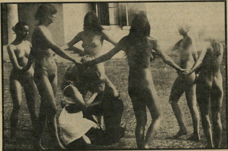
טכס החתונה של בן האצולה ובת האיברים אילו היה משווה את התקציב לפליני!