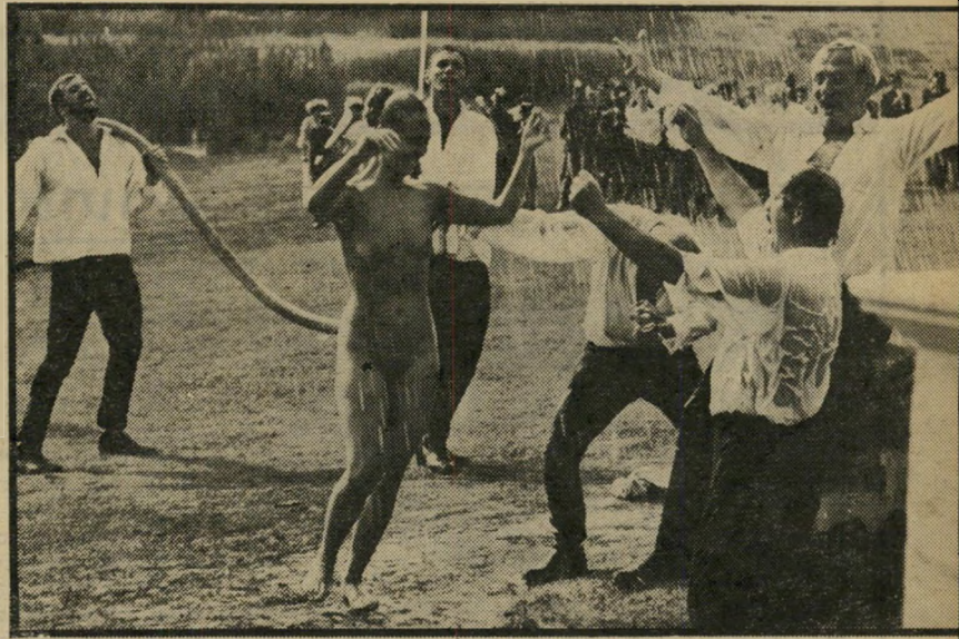
מרידת האיברים באצולה הופכת הגינה רטיבה לא לזיף, אלא לפענח את ההיסטוריה

שלו חייב לא מעט לטכניקה של הלחנת מוסיקה. מדים אבסטרקטיים. זאת התקופה המודרנית ביותר שבה עסק יאנקסו בשנים האחרונות, אבל לתילבושות יש עדיין חשי- בות מרבית, והעירום הנשי, המקשט את סרטיה, כמו שפסלים קלאסיים מקשטים את גני רומא, בולט כאן יותר מאשר בכל סרט מיוחד-אירופי אחר. "אנחנו מנסים תמיד למצוא את הצורות הכוללניות ביו- תר להבעת רעיונותינו," טוען גיולה הר- נאדי, התסריטאי הקבוע של יאנקסו. "מכאן השימוש במרחבי-שדה ריקים, בפרשים ובמדים היסטוריים, ומכאן גם השימוש בעירום. אלה המדים האבסטרקטיים ביותר, הם אינם שייכים לאף תקופה ולכל התק- רי