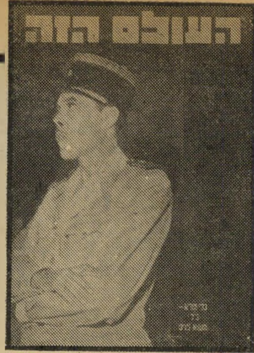
"העולם הזה" 872 תאריך: 8.7.54

הייתי פרא, אבל תמיד השתמשתי בראשי! השנים הלפו, אנשי פתח-תיקוה כמעט ושכחו את הכינוי שנתנו לראב שייגן, וזכרו יותר כי ביתו מוקף עצי הפרי שי מש תמיד מחסה ועזר למחתרות השונות, החל מנילי, דרך ההגנה עד אצל ולח"ל. ועכשיו ניגנה המוסיקה, עליזה וקולנית, ונישאו הנאומים, חמים ומכבדים, והוקן הצנזר הקשיב בעירנות, עקב בעיניו ה' עמוקות והבהירות אחרי הצעירים. הם דרשו נאום! נאום! והוא קם, הסתכל סביב, בו, אמר מילים מיספר, הפסיק. הוא פשוט לא יכול היה לדבר הלילה.