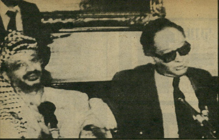
קאנצלר קרייסקי ויאסר עראפאת במסיבת-עיתונאים בווינה, "רק ישראל אינה מבינה..."

אינה מסוגלת להכריח את ישראל לסגת משטחים המיועדים להפוך המולדת לפלסטינים, הם יכולים רק להניח שאר-צות-הברית מוכנה להשלים עם כיבוש ישראלי מתמשך.