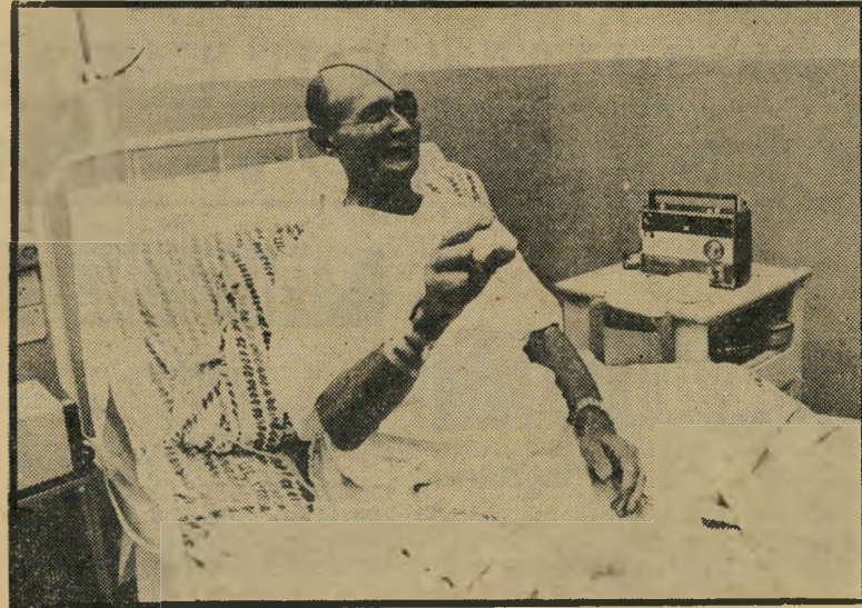
משה דיין אחרי הניתוח חרדה עמוקה ופחדים סתומים

אין אנחנו סבורים שיש להיכנע לפחד דים אלה. להיפך, אייזכרת השם המפורש מגדילה את הפחד, עוטפת את המחלה