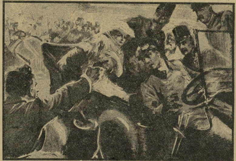
גאורדי פרינציפ מתנקש בחייו של הדוכס פריננד בסראייבו