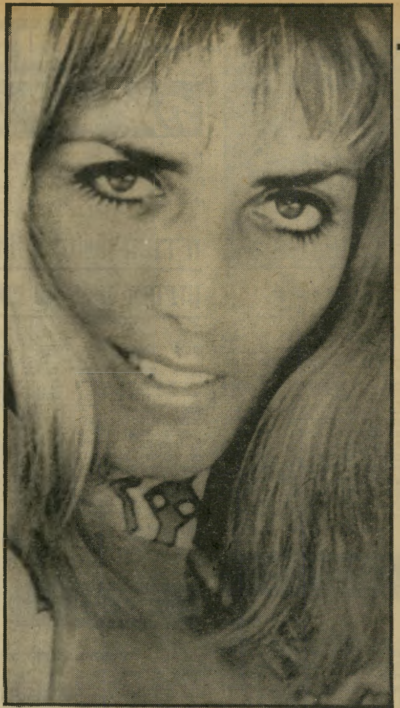
קסאוירה הולנדר בנעוריה לא לנשים בלבד

לתנוחה שבה שוכבת הבחורה על גבה, פושקת את רגליה והבחור שוכב ביניהן? הארי נוקש באצבעותיו. "בחי, עכשי ואני נזכר! זאת התנופה שלידי גיין הר-אתה לי". ● "אתה באמת רוצה אותי?" הדבר משול לשליפת גוף מחוץ לחלוטין מתוך מכונית מחוצה רק כדי לשאול את בעליו "נפצעת?" אחרי הכל, הוא עושה לך אהבה, לא? מה עוד הוא יכול לעשות? ● "אני טובה בשבילך?" המישפט הגאוני הזה מצוי בעמוד 331 של פייטון פלייט, שהופיע בשנת 1956. גשים רבות עד להחריד למדו אותו בעל-פה. ולגברים רבים במיספר שווה עד להחריד כבר יצא מהאף לשמוע את השאלה המטופשת הזאת של קונסטנס מקנדי.