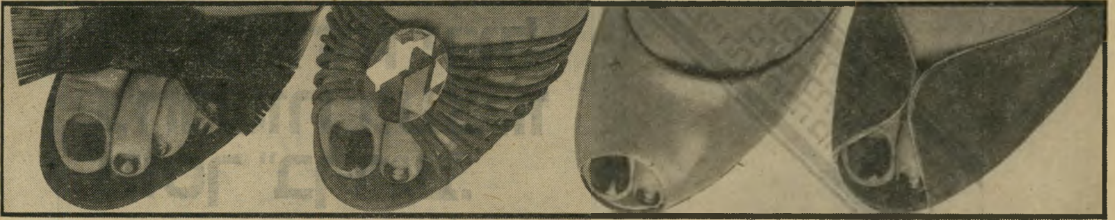
סנדלי הקיץ. מקום טוב באמצע לאצבעות, לשם הצצה. עקב דק וצר. הצבע השולט: סגול, אדום, כחול ובז'.

החצאית; זוהי החצאית שתסעיר את רוחם של הגברים; אם את רוצה להיות מושכת אל תותרי על החצאית הצרה. דברים אלה נאמרים עלייך מתכנני האופנה, אבל האם חשבת פעם, למשל, איך זה לעלות לאוטובוס בחצאית הדוקה לגוף? או איך אפשר לנהוג במכונית, כשכיפוף ברכך הוא מיבצע כמעט בלתי אפשרי? או אם, חס וחלילה, חטפו לך את הארנק ברחוב, איך אפשר לפתוח בריי צה אחר הגנב החצוף? אני לא אומרת שצריך להחרים את החצאית הצרה. לא בהחלט לא. אבל מצד שני, לא צריך להפריז במעלותיה. לעומתה, החצאית המוכרת בשם "קלוש" או חצאית הפעמון, היא על הכיפק. אורירית בימי הקיץ החמים, מסתירה אייאלו קילוגרמים שלא רוצים להיפרד מאיתנו. ועדיין לא נאמרה המילה האחרונה בנושא: איזו חצאית סכסית יותר, הצרה או הפעמון?