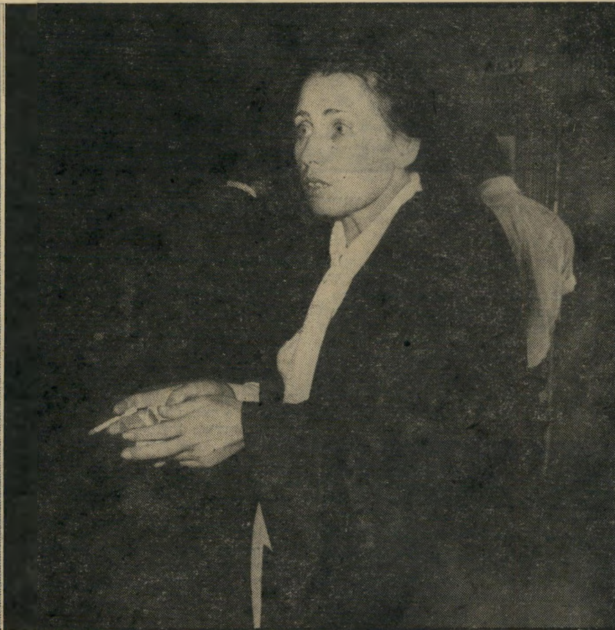
תובעת סירוטה „חוצפה!“

במעשיהו, או שהוא יתפוס חזרה את מקומו במליאת הכנסת, בקרוב.