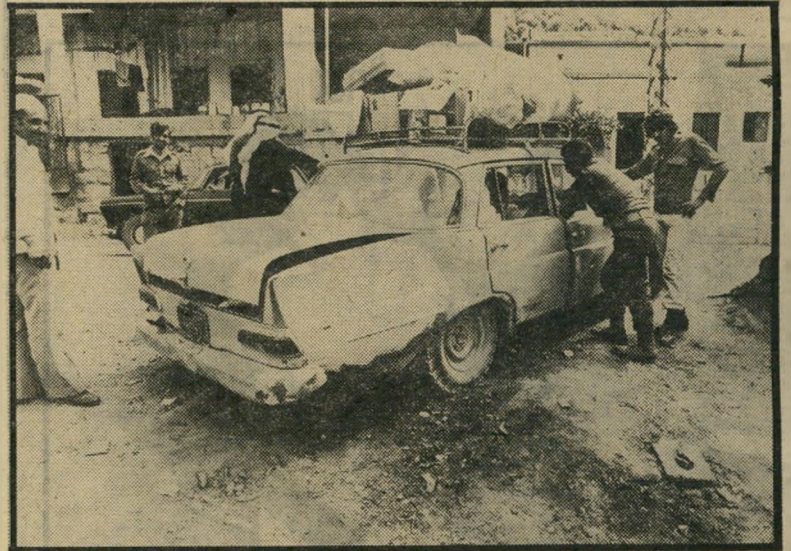
חיילי חדאד עורכים חיפוש במכונית שהגיעה מבירות. יש לי דרכים משל...

קצר לאחר מכן. אנתנו הזוים במראה ישראלי מאד פופולרי: מכונית מרצדס עמוסה לעיפה, שעליה רוכנים שלושה חיילים, העורכים בה חיפוש מדוקדק. המכונית הגיעה זה עתה מבירות. הדבר האחד שהוחרם ממוכה מייד היה עיתון בירות, המועבר לידיו של רביסרן חדאד.