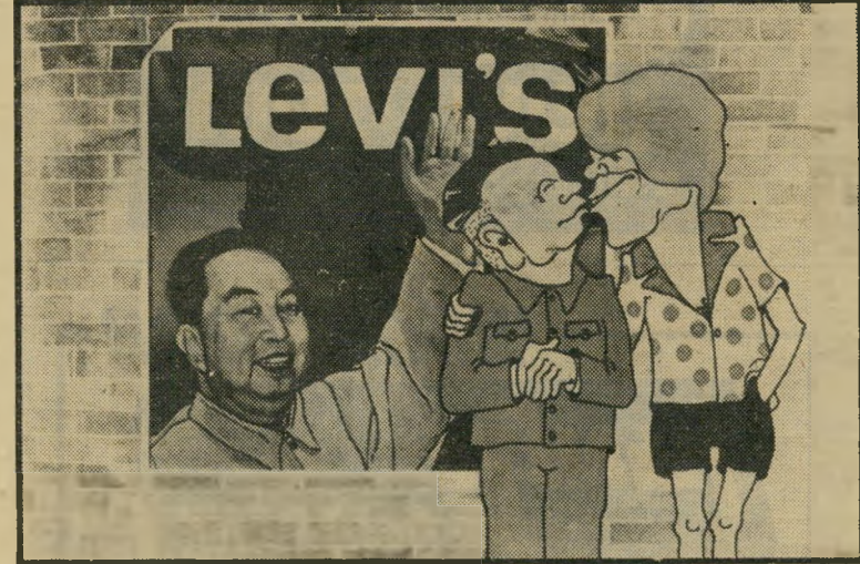
כל העולם אחים נשיקה מערבית