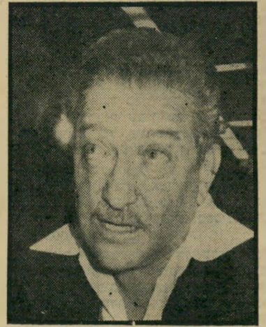
שרי הביטחון — לוקח תפקיד