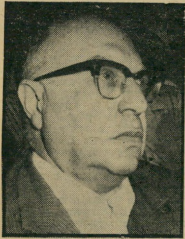
שרי הפנים — לוקח תקציב

ביותר על המישטרה, ושהמשאבים והמרץ המופנים לכיוון זה חסרים לפעילות הרגילה של המישטרה. הוא משוכנע כי גם מישטרה הגבול הוא נטע זר במישטרה. אולם בורג גם יודע, כי ברגע שנושא ביטחון הפנים ילקח ממישרדו, יצומצם תקציב המישטרה. כך שלא רק תיפועלה של המישטרה ייפגע, אלא גם כוחו שלו. כשרי המישטרה. ולכך אין הוא מוכן. המאבק בין צה"ל למישטרת ישראל, מתנהל עתה בשני מישורים. בין היתר מאשים המפכ"ל את הרמטכ"ל בכך, שבלייל הפיגוע בנהריה סירב ה-