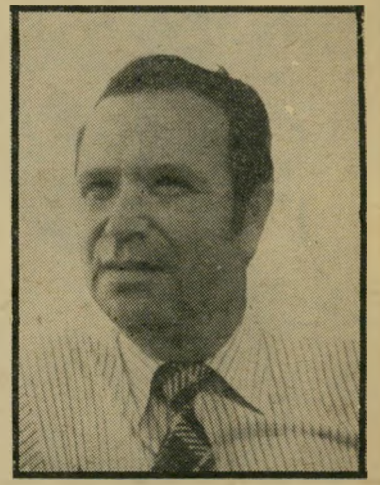
שר פת הייטל בוטל

הוצאת זב"מ (זמורה-ביתן-מודן) רכשה את הזכויות להוצאה לאור בעברית של אנציקלופדיה "לארוס" הצרפתית. הסידה תופיע בשוק בעוד כשנה וחצי. לשם כך הוקמה חברה מיוחדת, "זב"מ אני ציקלופדיות".