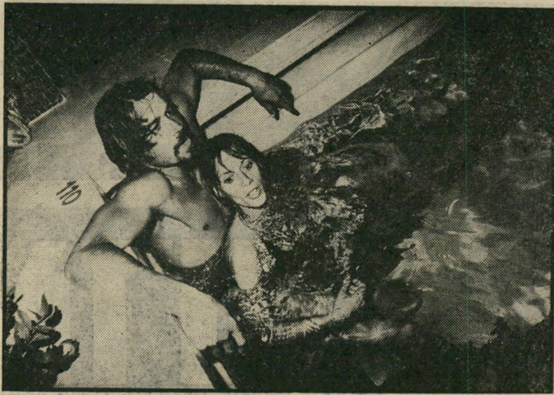
מונה זילברשטיין ושרגא הרפז רומן כמו בסרטים

בין השמועות הנפוצות בעיר מסתובבת גם השמועה שהרומן בין השחקנית מונה זילברשטיין לבין השחקן שרגא הרפז נגמר.