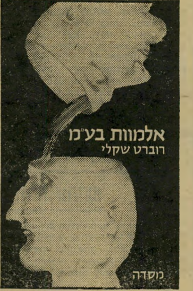
אלמוות בע"מ תלאות ואימה

"לפי חוק ההתאבדות משנת 2102, מהווה הצייד דרך חוקית לגמרי להתאבדות - בתנאי שהניצוד רכש לעצמו קודם לכן ביטוח לעולם הבא. העשירים שמיצו את כל תענות החיים הפכו ניצודים; קבוצה של רוצחים מיקצועיים היו הציידים. הניצוד בחר את הזמן, המקום וכלי-הנשק - כל דבר מרשית וקילשון או שלשלת-מתכת שכבוד משיגן בקצה, ועד לקולט 45 - זהבון עצמו ליהנות מהמאורע המסעיר ביותר בחייו השורפים..." כך כותב על