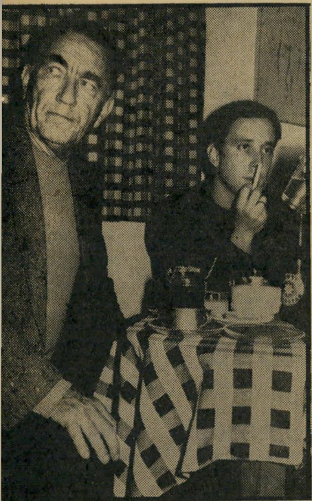
מייסד אבידוב וחזקין טפליץ כל מוסיקאי אידיאליסטי

מ"100 אלף לירות. "פנינו לכל מיני גור" מים" הוא מספר, "לבנקים, חברות, מוסיקאים, למועצת רמת-השרון. קיבלנו אומנם כמה תרומות, אבל זה עדיין לא מספיק. אנחנו צריכים בית יותר גדול. הרבה חדרי-אימון, חניונים בחורף ומיזוג אוויר בקיץ ועוד הרבה דברים."