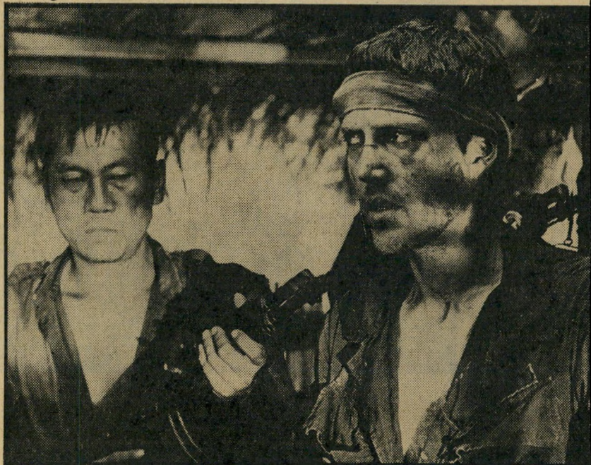
ניק (כריס טופן וולקן) בשבי הווייטקונג כיצד להישאר בחיים

תשובתו של צ'ימינו: "סירטי אינו ריי אליסטי. זהו סרט סוריאליסטי. אפילו הנוף הוא כזה. למשל — את העיירה שבה חיים גיבורי הסרט שלי, הנקראת קליירטון, הרכבתי מדמותן של שמונה ערים קטנות ודומות זו לזו בארבע מדינות שונות בארצות-הברית. את קליירטון עצמה אי אפשר למצוא על המפה. גם הזמן אינו מחושב על-פי הזמן המציאותי של התרחשויות. בכונה לדחוס ניסיון של מילחמה לתוך סרט, אפילו ארוך כמו שלי, (184 דקות) היתי חייב להפליג מן המציאות. אם מת-