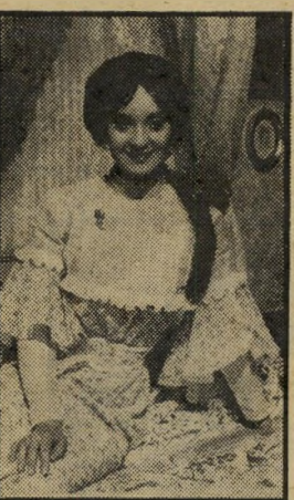
משרתים: פג'ט שעה 8.00

מי שזוכר את הקומדיה המצויינת של ארנסט לוביטש, להיות או לא להיות, ששברה את כל השיאים בקולנוע גם לפני שנתיים, לא יוכל שלא להישאר הערב בבית ולצפות בסרט בו מככבת קרול לומברד, הכוכבת של להיות שר או לא להיות. היא היתה שר