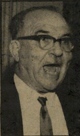
לוי אשכול שעה 9.30

עשר השנים שחלפו מאז פטירתו של ראש-הממשלה השלישי של מדינת ישראל הן זמן מספיק, ואף רב מדי, כדי לשר כוח את אלה ששנאוהו, שבזו לו ושרדשו את הסתלקותו מכס ראש-הממשלה. כאשר פרש דוד בן-גוריון ב-1963 הוא אמר על אשכול: "הוא לא יורש שלי, זה מגיע לו בזכות עצמו." אולם ב-1965 אמר אר"ת בן-גוריון על אותו אדם, כי "יש לשחרר את ישראל מהמישטר המושחת והמטומטם" שבראשו הוא עומד. הוא אף כינה את אשכול "שקרן" ו"פחדן". נשות-וינדור-העליונות שיהררו את תיק הביטחון מידיו של אשכול, לאחר שהשיעור את הגימגום המפורסם, ערב מילחמת ששת הימים, ל' העניקו אותו למשה דיין. ה' מפיץ יהודה קורן והבמאי אלי