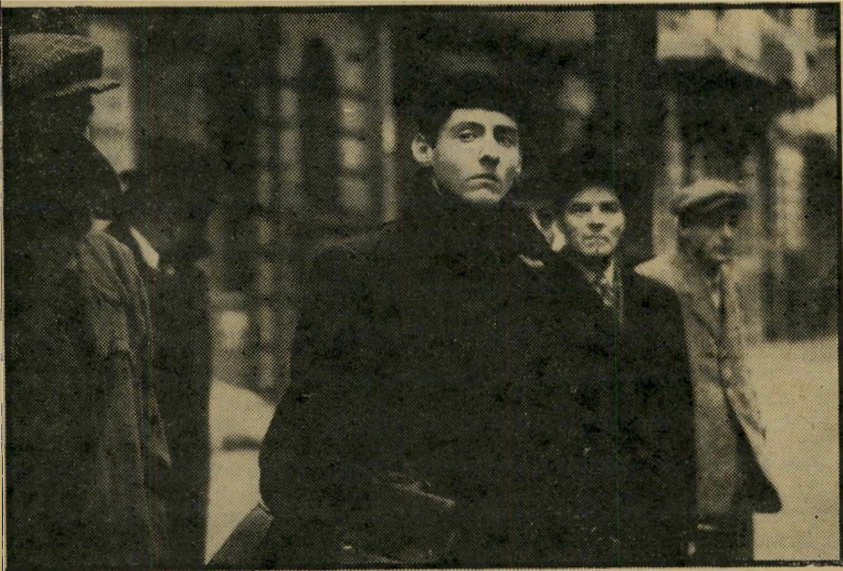
הסרט על השואה: "דויד" המסר הציוני

בוחר ליליאנטל להראות רק מה שראה אותו הנער. הסיפור מבוסס על ספר אוטוביוגרפי, והתוצאה היא כה מאופקת ורכה, עד שרבים חשו כאילו זו גירסה מדוללת של השואה הטלוויזיונית, אם כי למעשה זה סרט הרבה יותר נבון ומחושב.