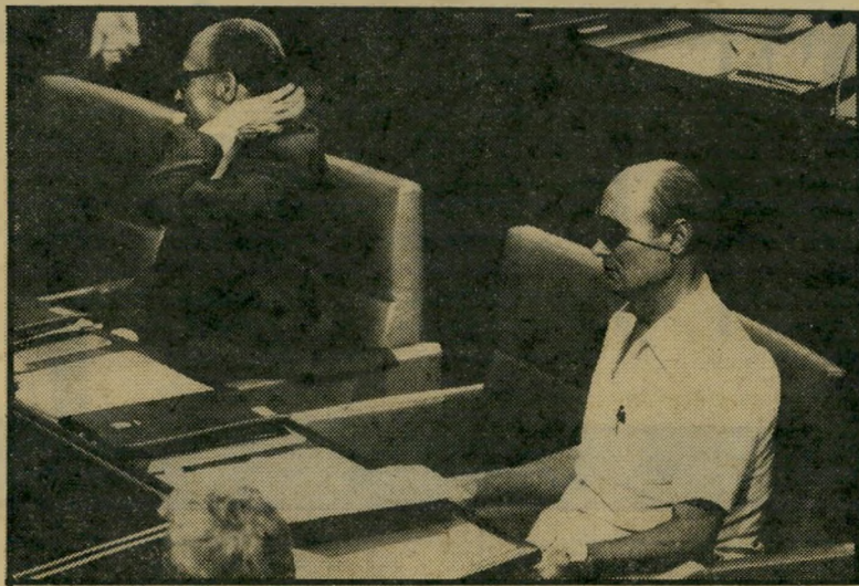
משה דיין ומנחם בגין: סטירת-לחי עולמית

עתה ברור כי נכשד בכך. המצרים ראו בו, מאז ועד-הלידס, וזיר העומד ליד אוזנו של השולטן והלוהש לו עצות. וזיר כזה מאבד את חשיבותו ברגע שהשולטן מרחיק ממנו את אוזנו. לעיני העולם כולו ספג שר-החוץ סטירת-לחי מצלצלת. הוא הורחק מן המשא-והמתן. כשם שהורחק ממנו וייצמן לפניו. בגין טס לארצות-הברית כדי להיפגש עם קארטר ועם סירווס ואנס. הוא נפגש עם שר-החוץ האמריקאי, מבלי ששר-החוץ הישראלי היה לצידו. לעיני העולם כולו הוצג שר-החוץ הישראלי ככלי ריק. לאמריקאים ולמצרים נאמר כי אינו נהנה עוד מאימון הממשלה. במצב כזה — איזה מעמד ואיזה ערך יש לשר-החוץ? לא קל למשה דיין להתפטר מתפקידו. אין לו בסיס מדיני עצמאי. אין לו מיסד לגה. אין הוא מהווה אף סיעת-יחיד ב"כנסת. כפוליטיקאי מחוץ לממשלה, הוא ימצא את עצמו בחלל ריק. אך יתכן מאד כי מחיר הישארותו בממשלה כזאת יהיה גבוה אף ממחיר פרישתו ממנה.