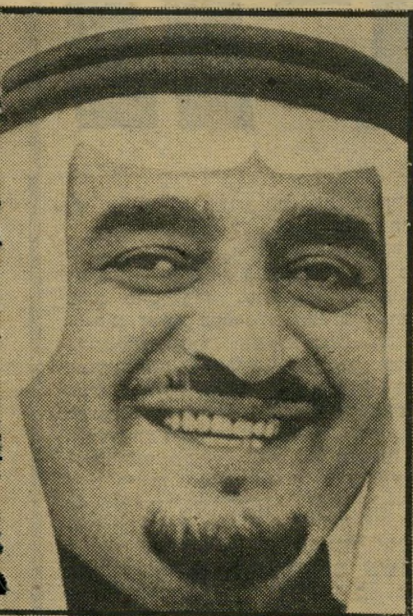
יורש-העצר הסעודי פאהד

אך החלק החשוב ביותר של פיסגת-בגדאד לא פורסם כלל. הוא נוגע לי-סנקציות.