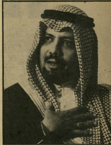
שר-הנפט הסעודי אליאמי כחה מן המוחות המבריקים בעולם

באותו זמן היו קברניטי המשק האמריקאי עסוקים בתרגיל דיסקרטי עדין. כדי