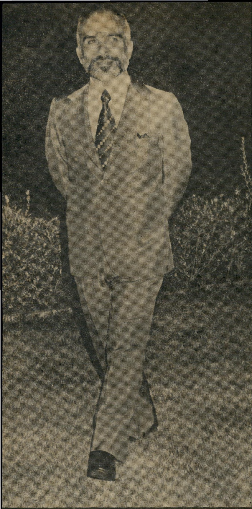
המלך חוסיין ועידית פריסנה בבגדאד

של ה-4 ביוני 1967. ותוך הענקת הגדרה עצמית לעם הפלסטיני.