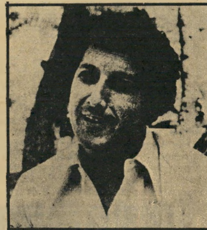
נאפו נזאר גרם לסערה

● אוהדי המלך חוסיין , הקיימים בעיקר בקרב השיכבה העליונה של האוכ-לוסיה, שיש לה קשרים עיסקיים ואחרים עם הממלכה ההאשמית. אלה פועלים על פי הקו שנקבע בעמאן.