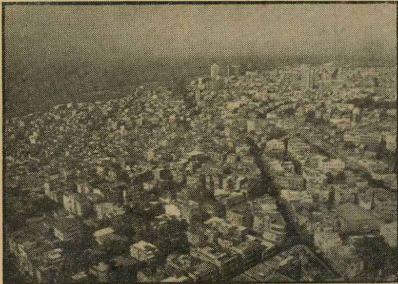
מראה כדלי של תל-אביב בגלויות התעמונה של אש"ף גם תל-אביב —

התגלגלה לידי גלויות-תיירות תמימה, אשר לדעתי כדאי להפנות אליה את