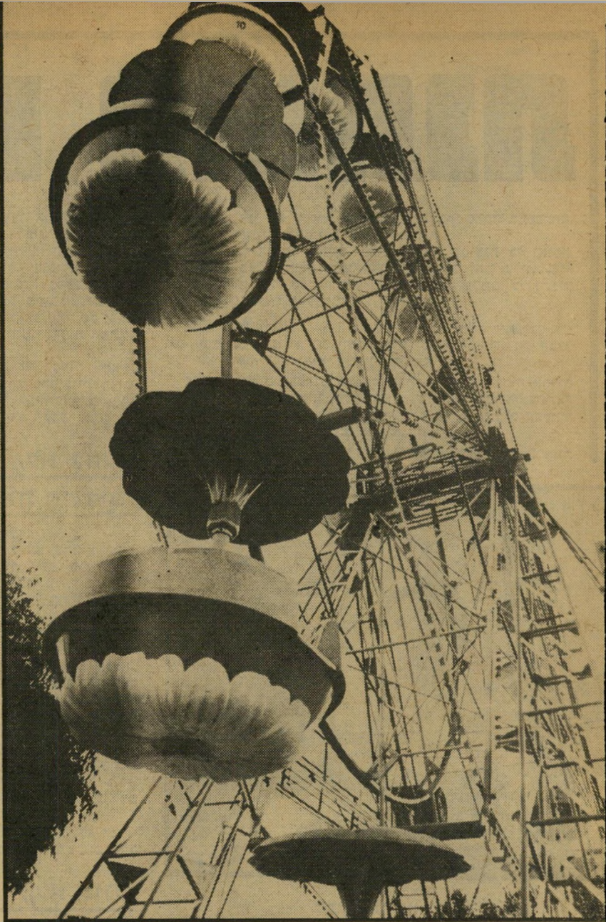
גניית-הענק ב"יריד-המזרח" בדיקה כמעט מדי-יום

אותו מפעילו באיטיות כדי להביא אל נקודת הירידה ממנו סל אחר בכל פעם. ואו, כשעמד סלם של הארבעה להגיע לשלב שלפני העצירה, אירע הדבר. הסל ניתק ממקומו בפיתאומיות, בגובה של כ- ארבעה מטרים מעל הקרקע, ונחת בחבטה. ההמון הרב שהתקהל סביב כלא נשימתו