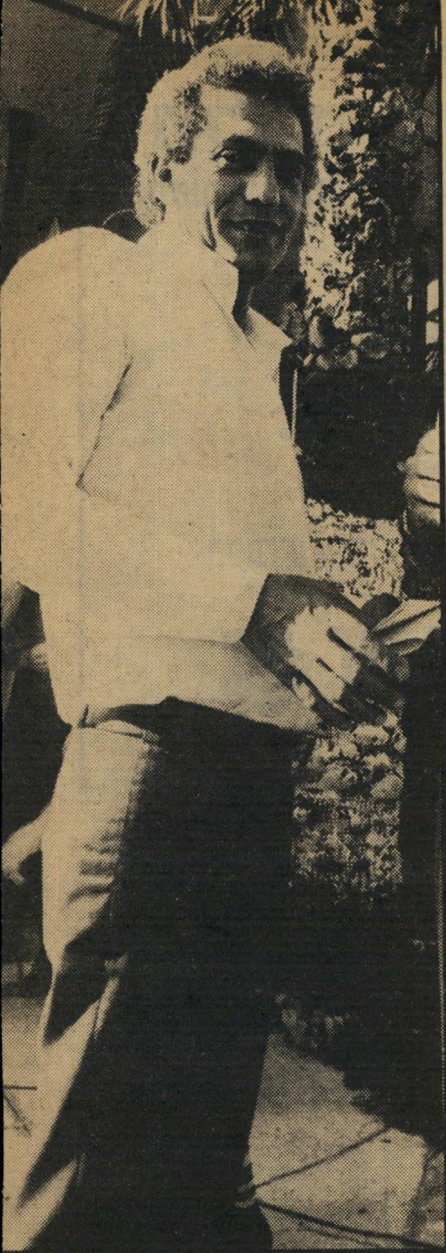
תובע מיוזחי האם הזכר השט?

חייבים לשמור אותו בנפרד, בלי כל קשר עם הצד האחר. יש לנו דרגות שונות של כאלה. פפה הוא אחד המיקרים החמורים. שהוא מתקין והוא מותקף. מאז שאני זוכר את הפרשות שלו בכלא זה... כהן: אולי זכורה לך הפרשה הזו? התקפה הספציפית, שהייתה בכלא דמון? תמיר: כן. כהן: שם הוא נחתך בפניו? תמיר: בדמון, לא. בדמון הוא נדקר בכמה מקומות. כהן: זכור לך שזה היה, זה התחיל בקטטה שפפה התחיל בה? תמיר: לא, עד כמה שאני זוכר היום, ברגע זה... כהן: אתה זוכר איך זה התחיל? תמיר: אני לא רוצה להיות מאה אחוז אחראי למה שאני אומר ברגע זה, כי אני מוכרה לראות. אבל הוא היה במעבר, הנמחה לי ושהוא הרבא לאיזה חדר לשתות כוס תה או כוס קפה. ושם כבה האור והוא נדקר. כהן: מר תמיר, אולי אתה מוכן להייד שחוקתך, הוא התקין התקפה רצינית מאד אסירים אחרים? תמיר: הוא היה או ובארי-שבע. כהן: אני יודע. אני שואל אותך אם יודע לך על קטטה רצינית שפרצה בינך מתו. תמיר: לא זכור לי, אבל אני מוכן לבדוק את זה. כהן: עכשיו, בכלא שאטה, זכור לך שיקדמה להתקפה על פפה התקפה שלו על אסירים אחרים? תמיר: לא, במיקרה הזה שהוזכר עכשיו... כהן: נגבתה ממנו איזו שהיא הודעה בנושא הזה? תמיר: המיטרה הוזמנה לחקירה, זה אנחנו עושים בדרד-כלל, מומינים את הי מיטרה במיקרים כאלה, והוא לא הגיש (המשך בעמוד 40)