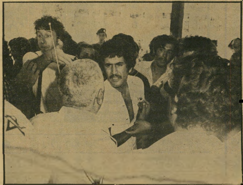
סרנים מונעים מסטודנטים להיכנס להרצאת שרון הכנות לניסיון-התפרצות

„לא יהיו כל ניסיונות להיכנס לאולם בכוח,“ קרא ברמקול אחד המפגינים נגד מדיניות הממשלה והשר. כאשר נשא השר את דבריו באולם, עמדו המפגינים בחוץ כשהם מתוחכמים עם אנשי-הביטחון הרבים בפתח, שמנעו מהם א תהכניסה. הסטודנטים, חלקם מבני-המיי-עוטים, דרשו שיינתן להם להיכנס לאולם, שהיה מלא רק בחלקו. אך כיוון שלא היו מצויידים בהזמנות הדרושות נמנע מהם השר כמעט הפכו תיגרה רבת-משתתפים.