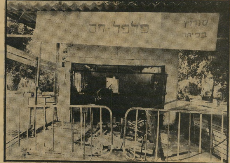
הפיצוץ האחרון: בית-הקפה בפרדס-כץ, אס אפוצץ, אפוצץ את עצמי — בתחנת המישטרה

בגיל צעיר מאביו אשר נפל במיבצע קדש. אמו עברה לפתח-תיקוה, ושם נישאה ב' שנית. לפני המעצר האחרון מצא כץ עובר דה במוסד ממשלתי, אך מייד אחרי שוחרר רר עמד לקבל מיכתב-פיטורין. רק בהשית תדליות רבות גינתה לו הזדמנות נוספת להמשיך. האם תתן לו הזדמנות כזו גם המישטרה?