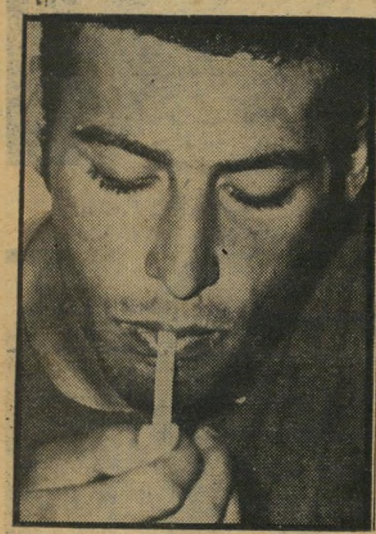
משוחרר כחיון, "בלאגן כל היום"

בדתי ביהלומים, באו ועצרו אותי על הפיצוץ של יום-הכיפורים בקריית-אונגו, והייתי עצור 30 יום. כששרחרתי, באתי לבעל-הבית שלי במילטשה, אבל הוא לא רצה אותי. מה הוא צריך חב' לנים אצלו? איפה שיש איזה התפרצות, מייד עוצרים את כץ. היה פיצוץ במועדון-הביליארד של האחים נגר בפתח-תיקוה, אני את מי עוצרים חשוד — את כץ. אני הולך ברחוב בקריית-אונגו, אנשים מסתכלים עלי בחשד, אף אמה לא רוצה שהבן שלה יתחבר איתי. מי שבא איתי במגע — נעצר כחשוד. יש לי אשה ושני ילדים, ממה הם רוצים שאני אפרנס אותם? איך אני אצא מזה?"