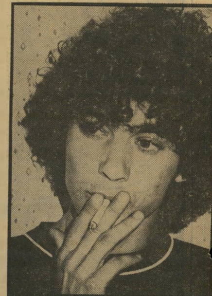
משוחרר וייצמן, אליבי לכל עת.