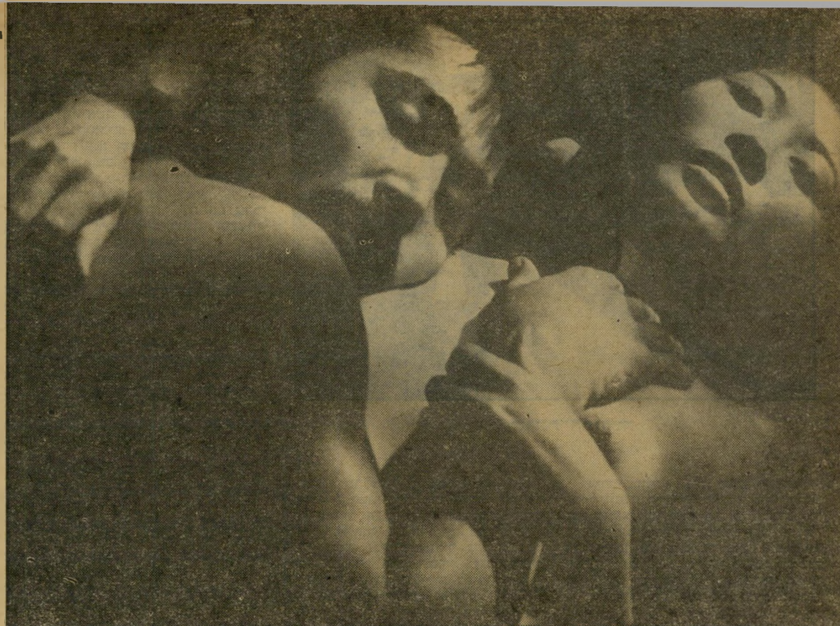
האשה ומאהבה בסרטו של אושימה, "ממלכת התשוקות" פרס הבימוי